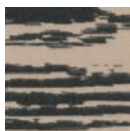
CMO APL 07 80