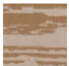
CMO APL 07 72