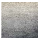
CMO ATA 07 82