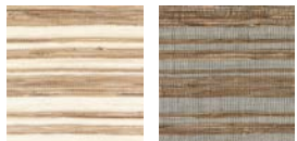
CMO FAB 18 10