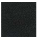
CMO FAL 01 80