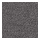
CMO FAL 01 82