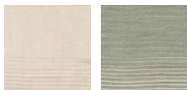
CMO FAL 03 10