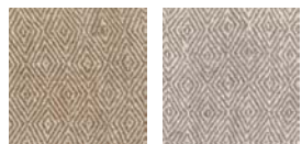
CMO FBA 05 72 CMO FBA 05 84