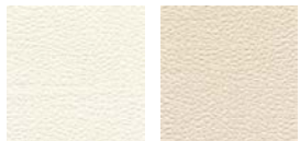
CMO FLI 08 01