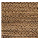
CMO WAB 08 75