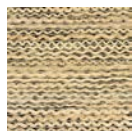
CMO WAB 08 80