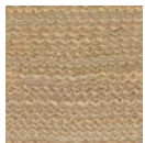
CMO WAB 08 20