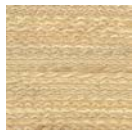
CMO WAB 08 01