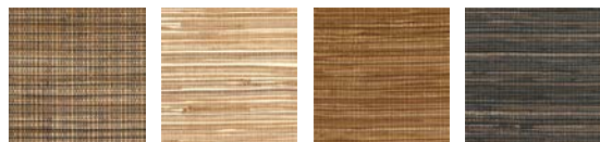
CMO WAB 10 10