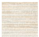
CMO WAB 10 01