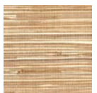
CMO WAB 10 20