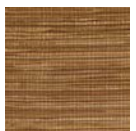
CMO WAB 10 72