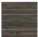
CMO WAB 10 80