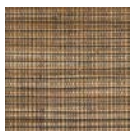
CMO WAB 10 10