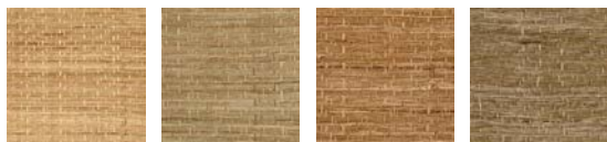
CMO WAB II 10