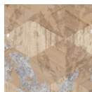
CMO WBO 06 21