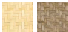
CMO WBB 03 10 CMO WBB 03 79