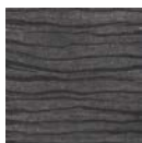
CMO WLI 03 80