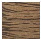
CMO WLI 03 75