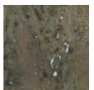
CMO WLI 04 69