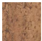
CMO WLI 04 74