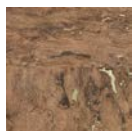
CMO WLI 04 10