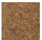
CMO WLI 06 72