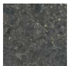
CMO WLI 06 69