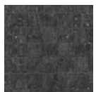
CMO WLI 07 69