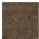
CMO WLI 07 75