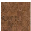
CMO WLI 07 72