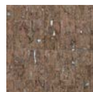
CMO WLI 07 81