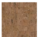
CMO WLI 07 10