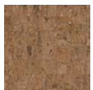
CMO WLI 07 10