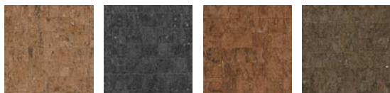
CMO WLI 07 10