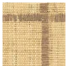
CMO WRA I2 72