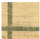
CMO WRA 12 69