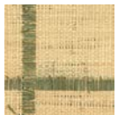
CMO WRA 12 69