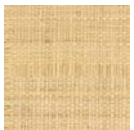
CMO WRA 12 10