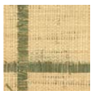
CMO WRA I2 69