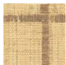
CMO WRA I2 72