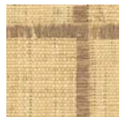
CMO WRA I2 72