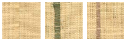
CMO WRA 14 10