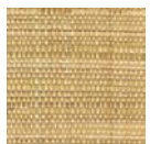
CMO WRS 04 10