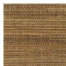
CMO WRS 04 72