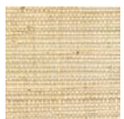
CMO WRS 04 01