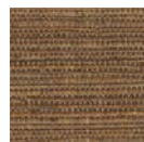
CMO WRS 04 75