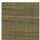
CMO WRS 04 65