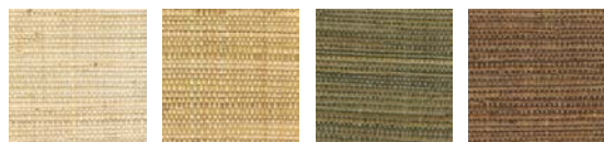
CMO WRS 04 01