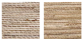
CMO FAB 17 01