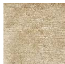
CMO ATA 18 78