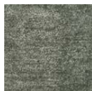
CMO ATA 18 69