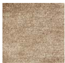
CMO ATA 18 73