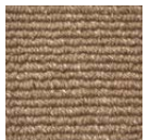
CMO ATA 19 73