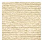
CMO ATA 19 10