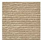
CMO ATA 19 78