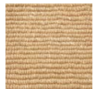
CMO ATA 19 92