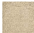
CMO ATA 21 86