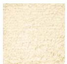
CMO ATA 21 10