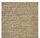
CMO ATA 21 78