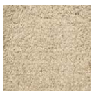
CMO ATA 21 86