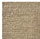
CMO ATA 21 78