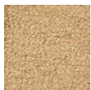
CMO ATA 21 92