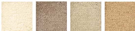
CMO ATA 21 10