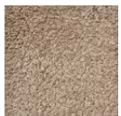
CMO ATA 21 73