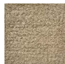
CMO ATA 21 78