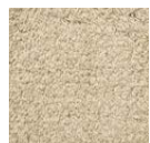
CMO ATA 21 86